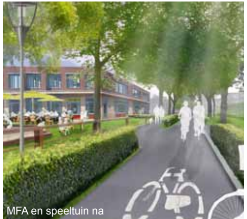
MFA en speeltuin na