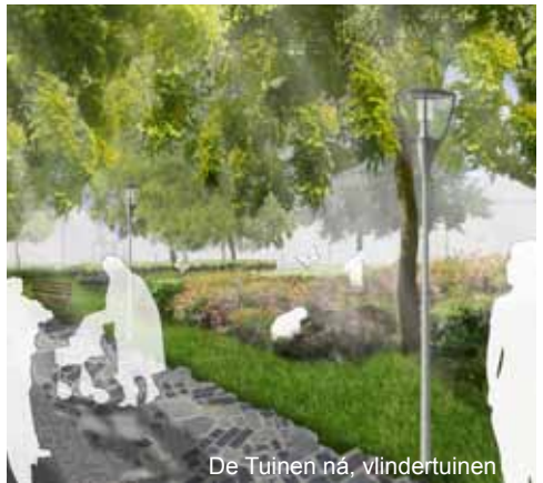
De Tuinen ná, vlindertuin