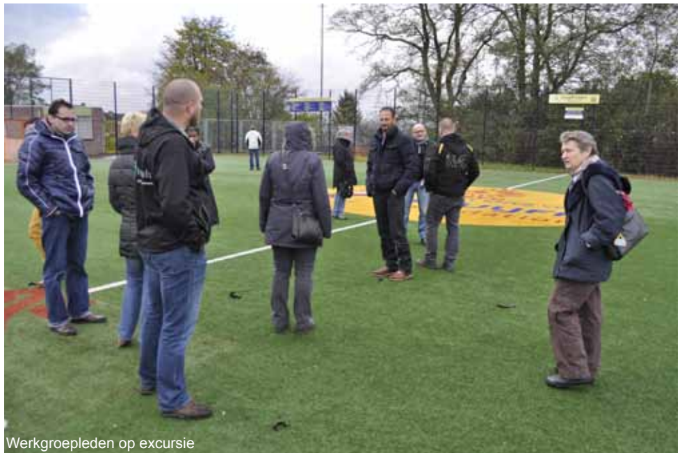
Werkgroepleden op excursie