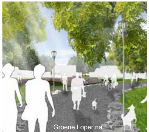
Groene Loper na