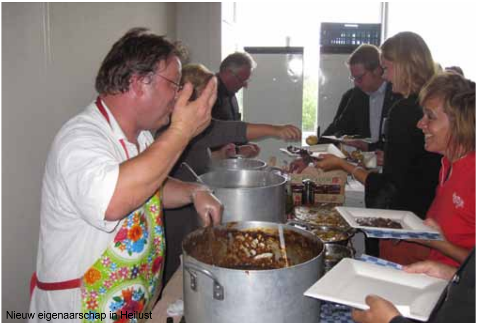
Nieuw eigenaarschap in Heilust