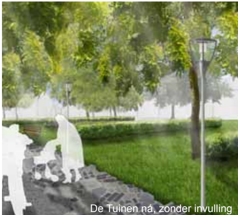
De Tuinen ná, zonder invulling