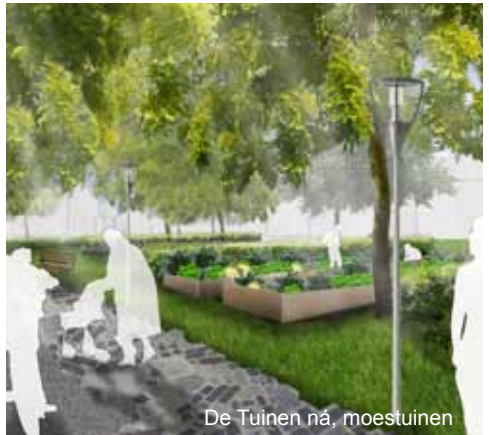
De Tuinen ná, moestuinen