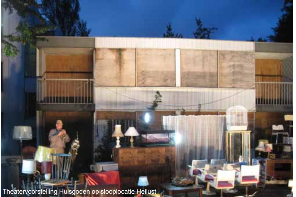
Theatervoorstelling Huisgoden op slooplocatie Heilust