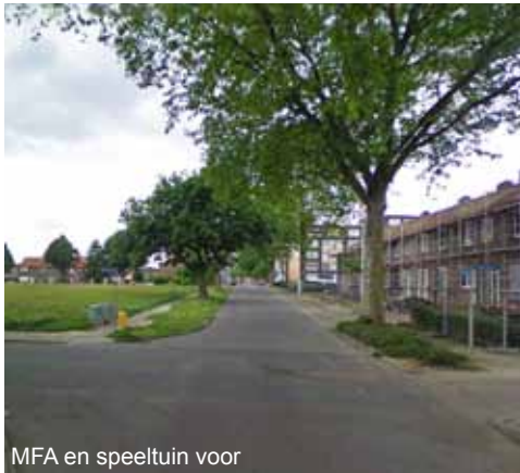
MFA en speeltuin voor