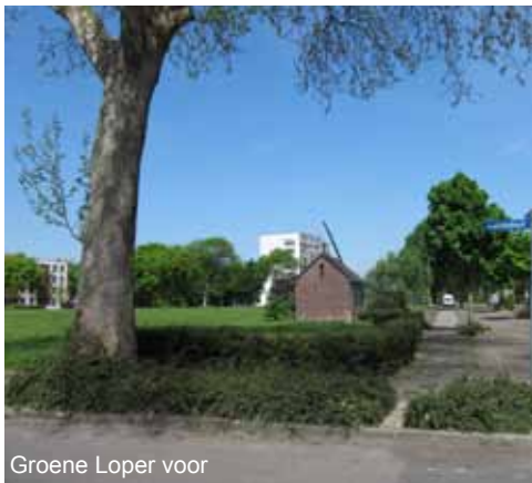
Groene Loper voor