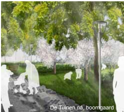
De Tuinen ná, boomgaard