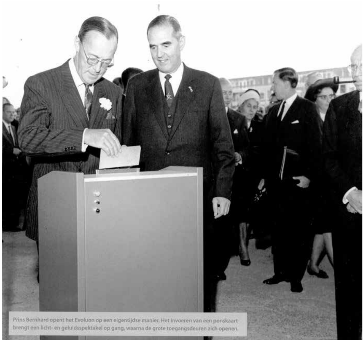
Prins Bernhard opent het Evoluon op een eigentijdse manier. Het invoeren van een ponskaart brengt een licht- en geluidsspektakel op gang, waarna de grote toegangsdeuren zich openen.