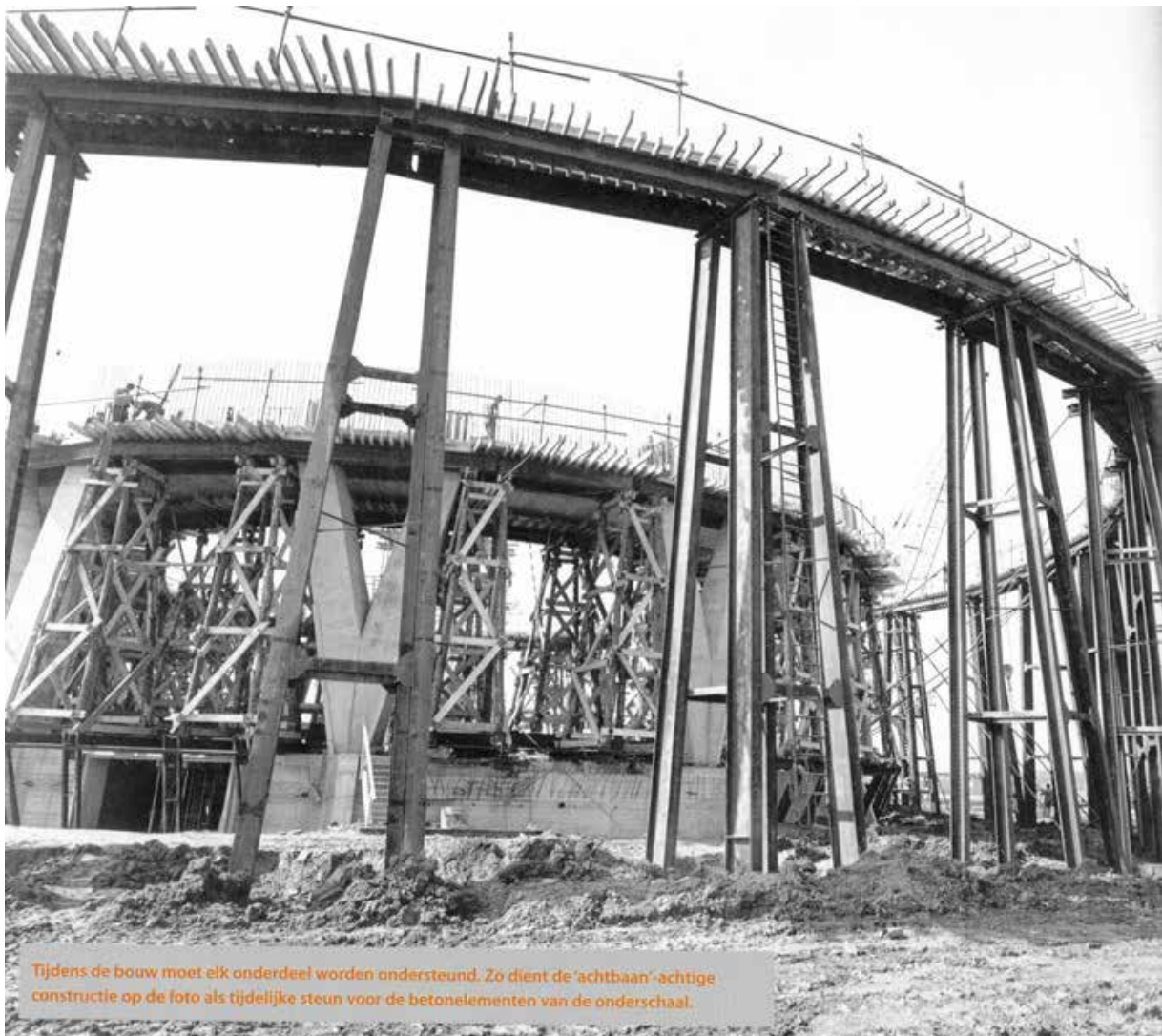
Tijdens de bouw moet elk onderdeel worden ondersteund. Zo dient de 'achtbaan'-achtige constructie op de foto als tijdelijke steun voor de betonelementen van de onderschaal.