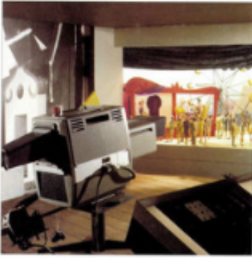
Evoluon, permanente tentoonstelling ingericht door James Gardner, 1966 114