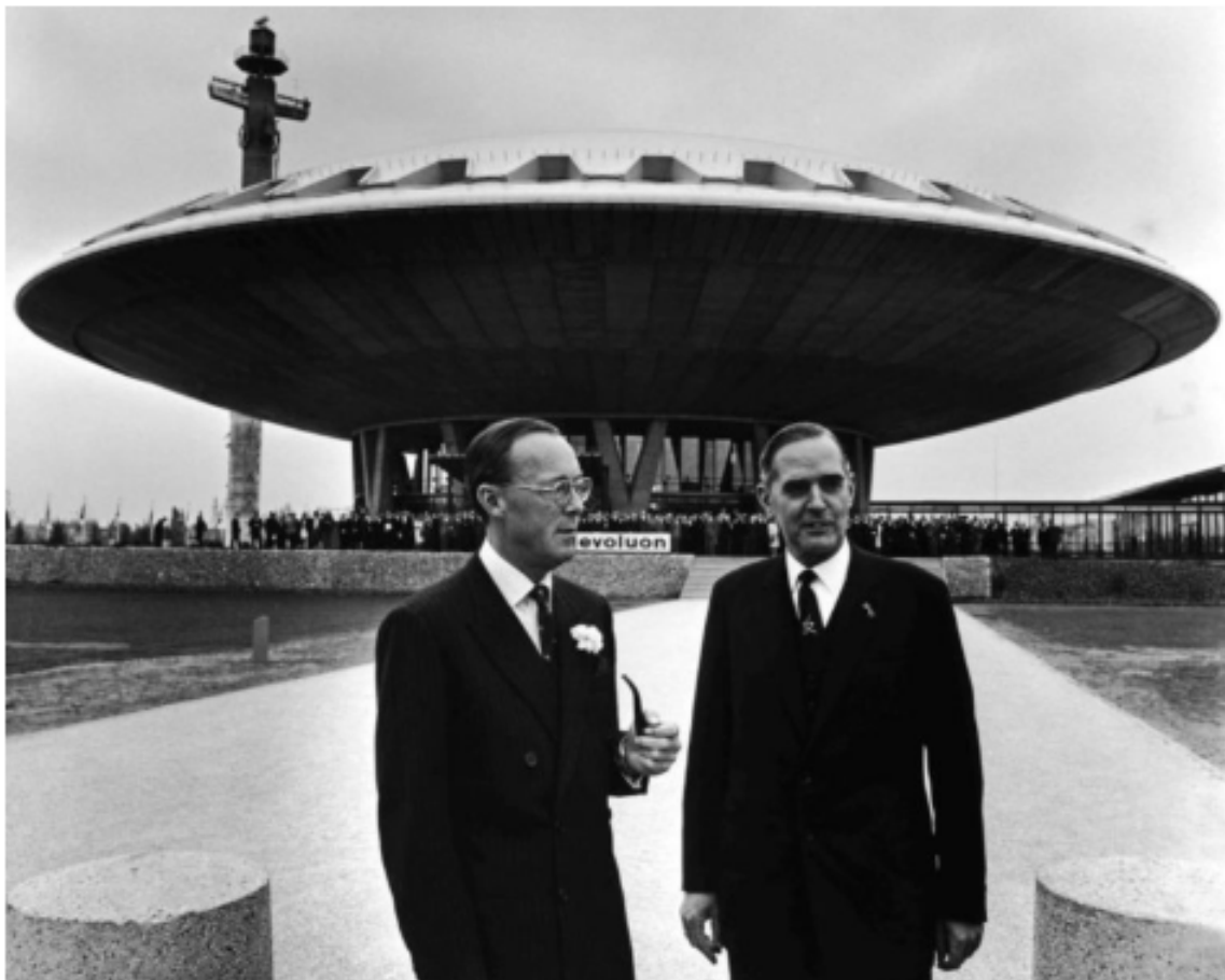
Prins Bernhard en president-directeur Frits Philips bij de opening van het Evluon in 1966.