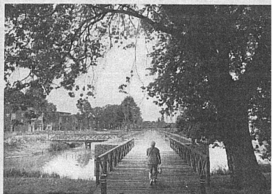
• 4. Een aantal oude bomen uit de tijd van Concordia is behouden.