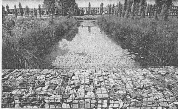
• 1. Schanskorven, zoals op de voorgrond, fungeren als kademuren rond de eilandjes.

Veel eilanden dus, die op een aantal plaatsen worden begrensd door kademuren, gemaakt van schanskorven. De schanskorf, een openstapeling van losse stenen die bij elkaar wordt gehouden door gaaswerk, is een element dat steeds terugkeert in het uit twee delen (aan weerszijden van de Simon Stevinweg) bestaande park. Net als de houten bruggen die de eilanden met elkaar en het 'vasteland' verbinden. Joris van Esch had het liefst ook een brug gehad