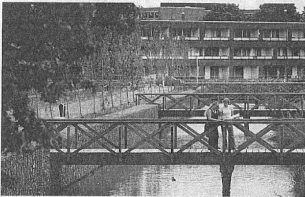
• 3. Houten bruggetjes verbinden de eilandjes met elkaar.