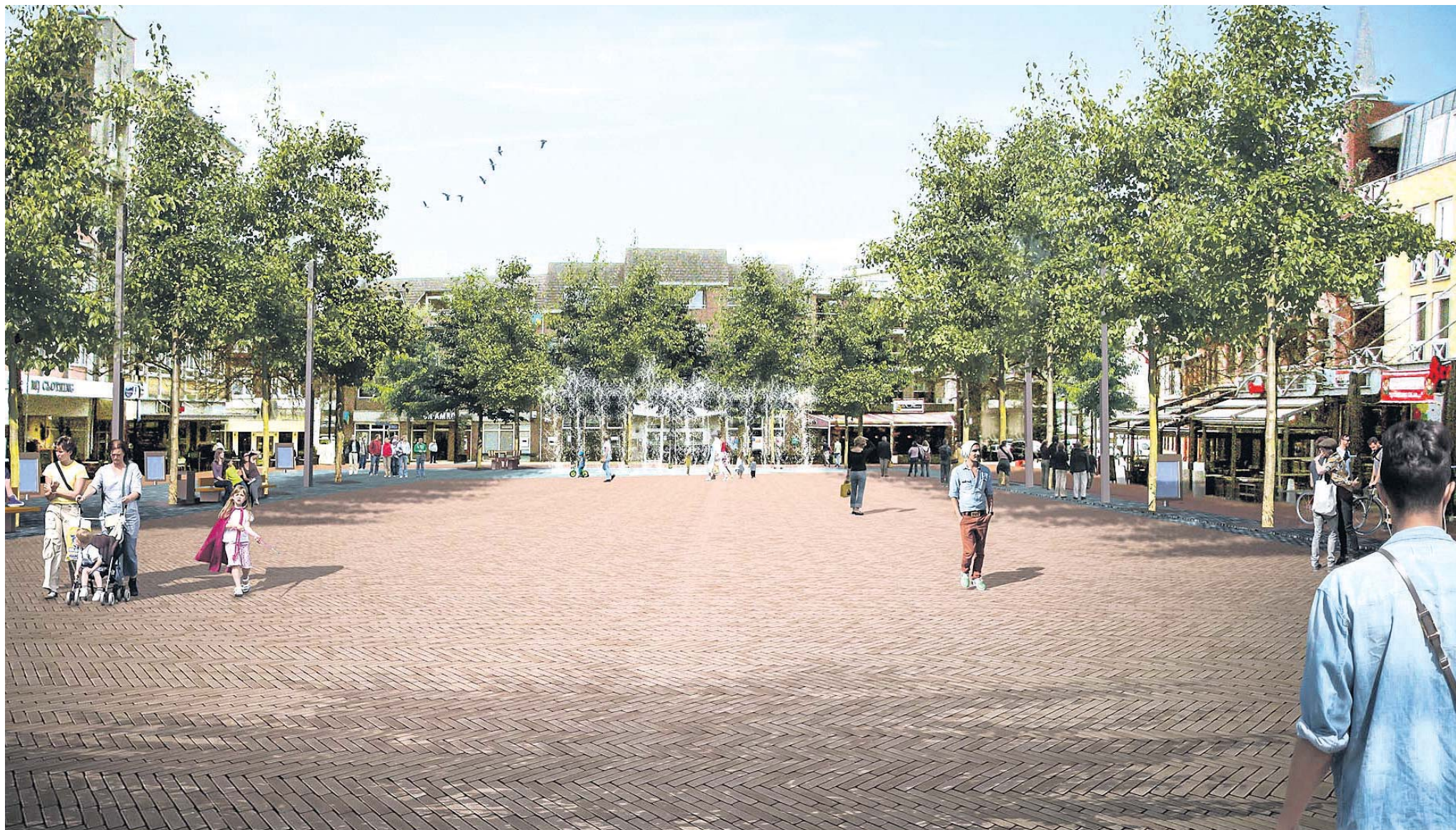
Een impressie van de toekomstige Markt in Kerkrade: de huidige bestrating, die volgens de gemeente versleten is,

wordt straks vervangen door 'rustige' roodbruine klinkers.