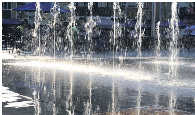
Op de plek van de vroegere Focus-kiosk komt een spectaculaire fontein.

Begin juni moet het plein er als nieuw bij liggen. Met als grote attractie een fontein die op de meest onverwachte momenten begint te spuiten.