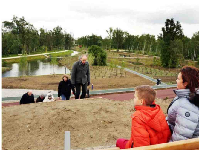
Vanop de heuvel heb je een mooi uitzicht op het nieuwe park.