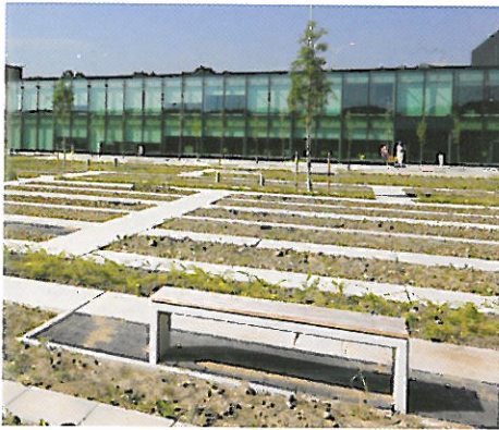
Tuin na aanleg in 2008.