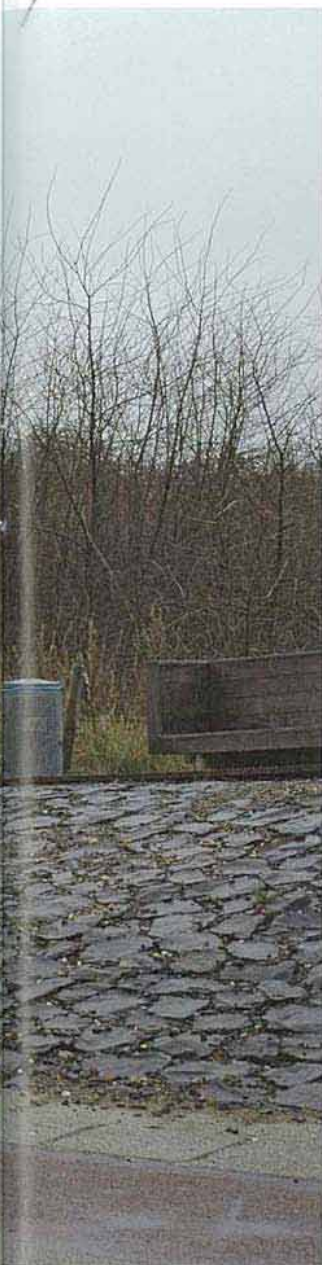
Vijf meter hoog verheft de bijna 40 m lange trap zich over het duin.