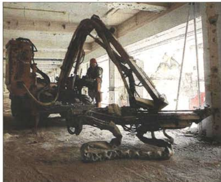
Met een speciale verrijdbare boormachine worden gaten in de dragende pijlers geboord, die kort voor de ontploffing met dynamiet gevuld worden.

Amerika, maar ook in andere Europese landen verloopt zo'n voortraject veel soepeler." De voorbereiding bevat een draaiboek vol noodzakelijke stappen. Meest opvallende is die van de afsluiting van het luchtruim boven het R-terrein. De opwaartse luchtdruk kan een risico vormen voor het overvliegend verkeer. „Een kwartier voor de explosie hebben we een laatste check met de luchtverkeersleider", legt Van Nielen uit. „We verwachten zeker 15000 mensen en raden bezoekers aan de auto thuis te laten. De omgeving van het terrein is voor auto's hermetisch afgesloten." Het dynamiet wordt op de dag van de ontploffing in de vooraf geprepareerde gaten aangebracht. Als alle seinen op groen staan rest er op de achtste mei om 14.00 uur nog maar één taak: een druk op de knop waarmee RAF een laatste stofwolk uitblaast.