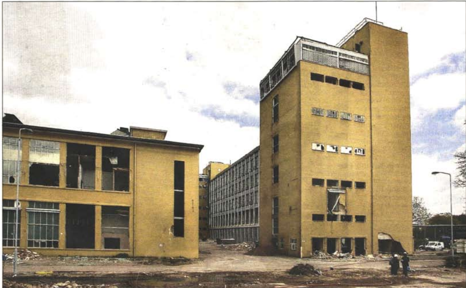
Gebouw RAF (rechts), afgelopen donderdag. Het voorste en middelste deel stort naar links, de achterste toren naar achteren.