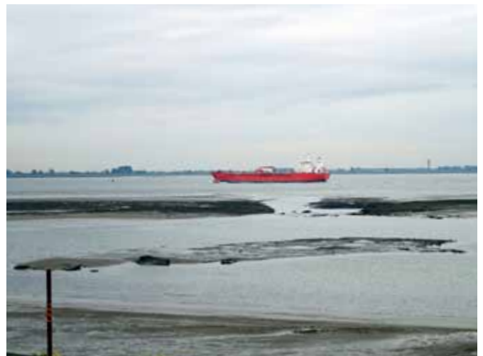
Nieuw buitendijks natuurgebied

Het plan voor Perkpolder is een treffend voorbeeld van ontwikkelingsplanologie waarin Buro Lubbers vanaf het eerste moment een belangrijke rol speelt. In 2006 stelde Buro Lubbers een haalbaarheidsstudie op samen met Rijnboutt Van der Vossen Rijnboutt en private en publieke ontwikkelingspartijen. In 2007 heeft Buro Lubbers het schetsplan in de maat gezet ten behoeve van een telmodel om in 2008 het stedenbouwkundig schetsontwerp en de beeldkwaliteit te formuleren. In 2009 zijn het stedenbouwkundig plan en inrichtingsplan opgesteld. In 2015 is de aanleg van het nieuwe getijdengebied afgerond en kan het buitendijks natuurgebied zich ontwikkelen. De volgende uitvoeringsfase in de gebiedsontwikkeling betreft het dorpshart. Het project Perkpolder laat zien dat Buro Lubbers alle landschappelijke en stedenbouwkundige processen beheerst om van een intentie tot gebiedsontwikkeling tot een gedetailleerde inrichting te komen.