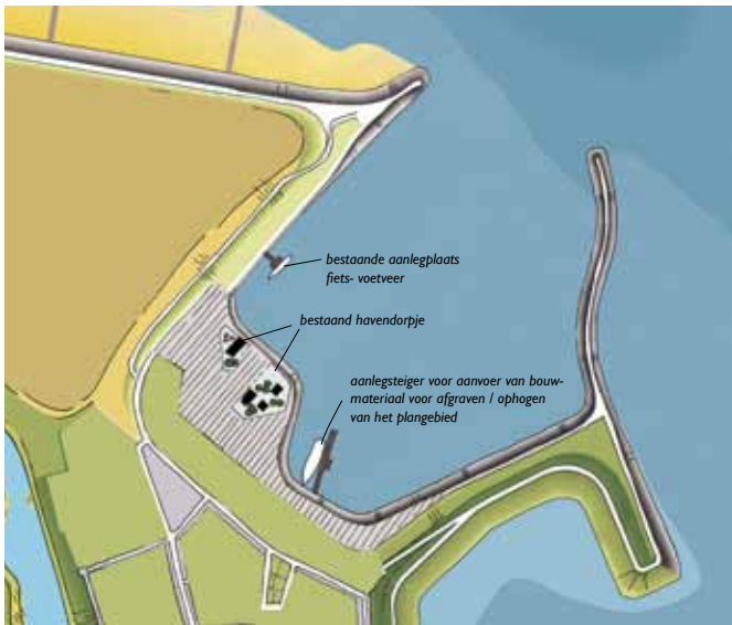
Ontwikkeling haven: fase 0