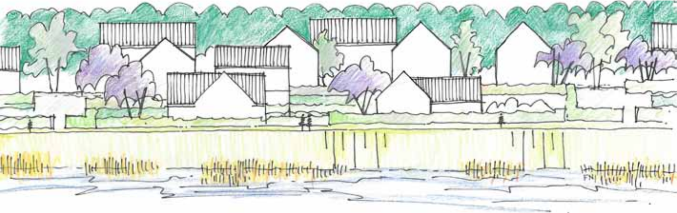
Aanzicht terrassen Hart