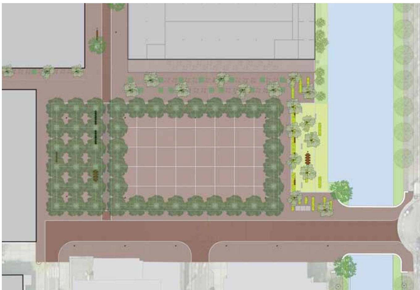
plankaart markt Schalkstad