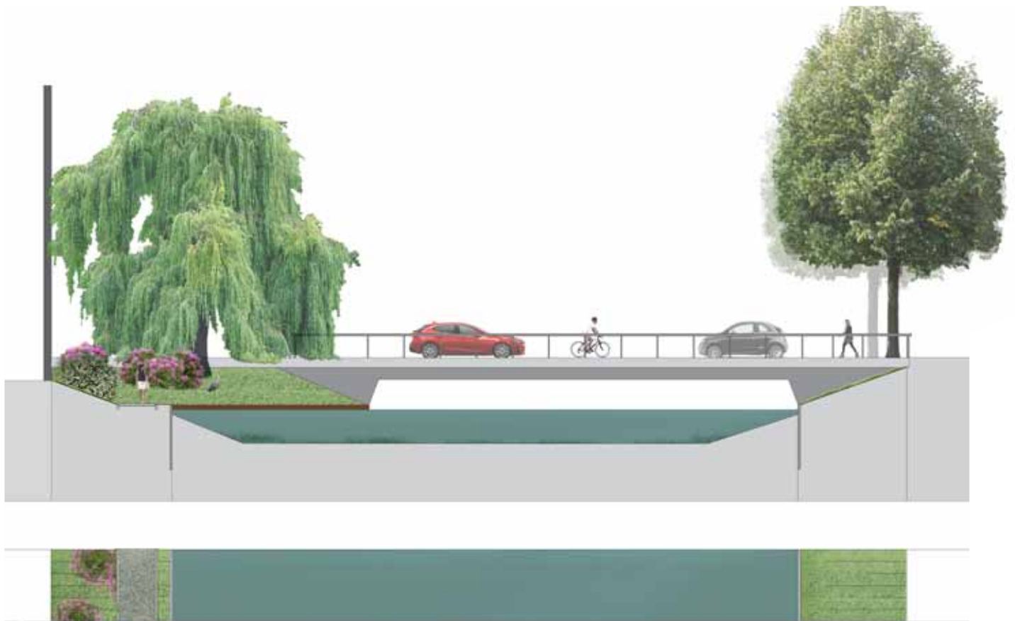
profiel aanzicht brug