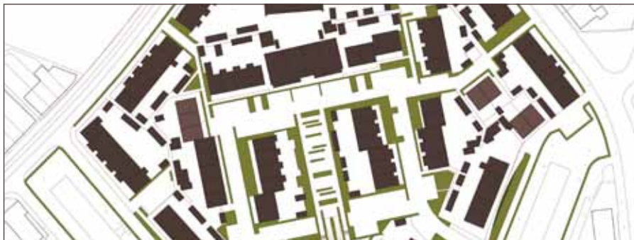
huidige functies lunetten